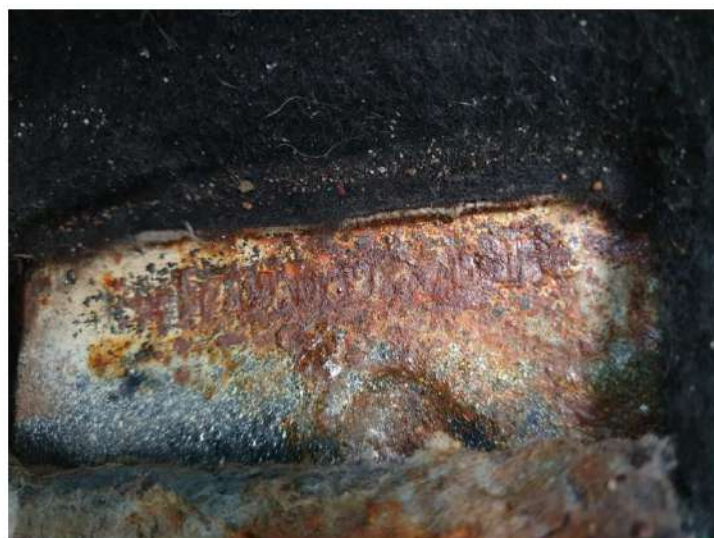
skorodowany nr VIN