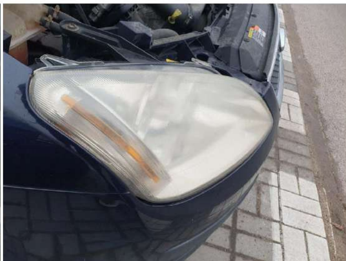
zmatowiałe lampy przednie