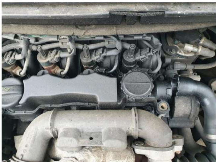
zaolejenie układu wtryskowego