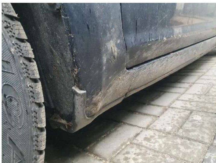
korozja błotnika przedniego lewego