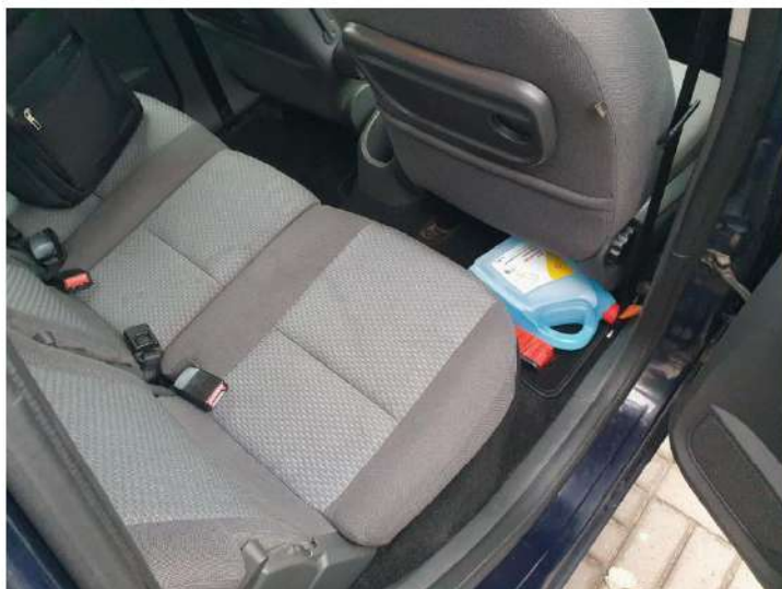
zabrudzone tapicerki wnętrza